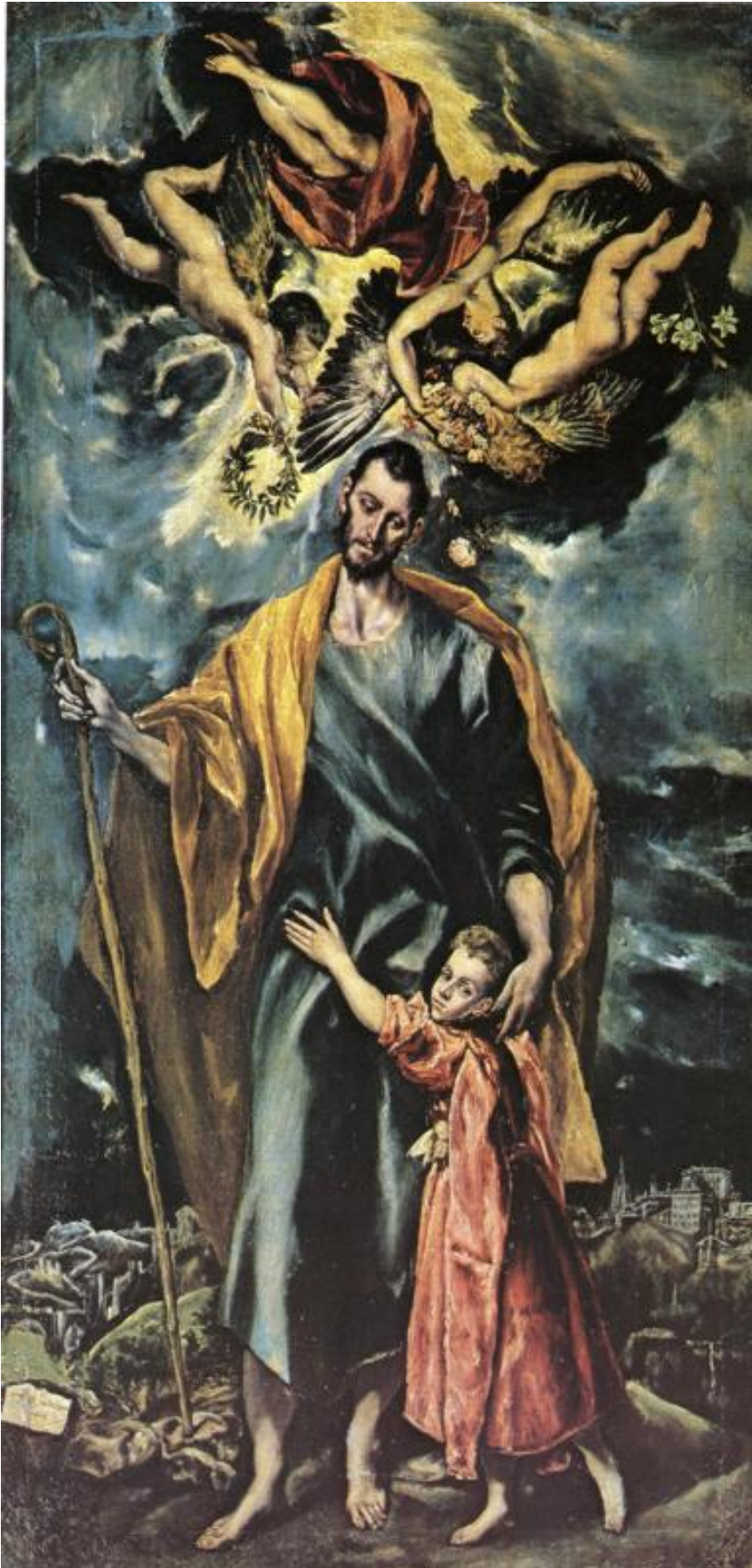
Paroisse saint Albert le Grand