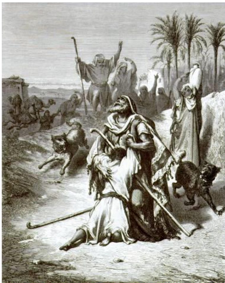
Le retour de l'enfant prodigue par Gustave Doré.

5. Non, Tu n'as pas trouvé créature sans tâche Au milieu des éclairs Tu nous donnas ta loi ..... Et dans ton Cœur Sacré ô Jésus je me cache Non, je ne tremble pas car ma vertu c'est Toi. (bis)